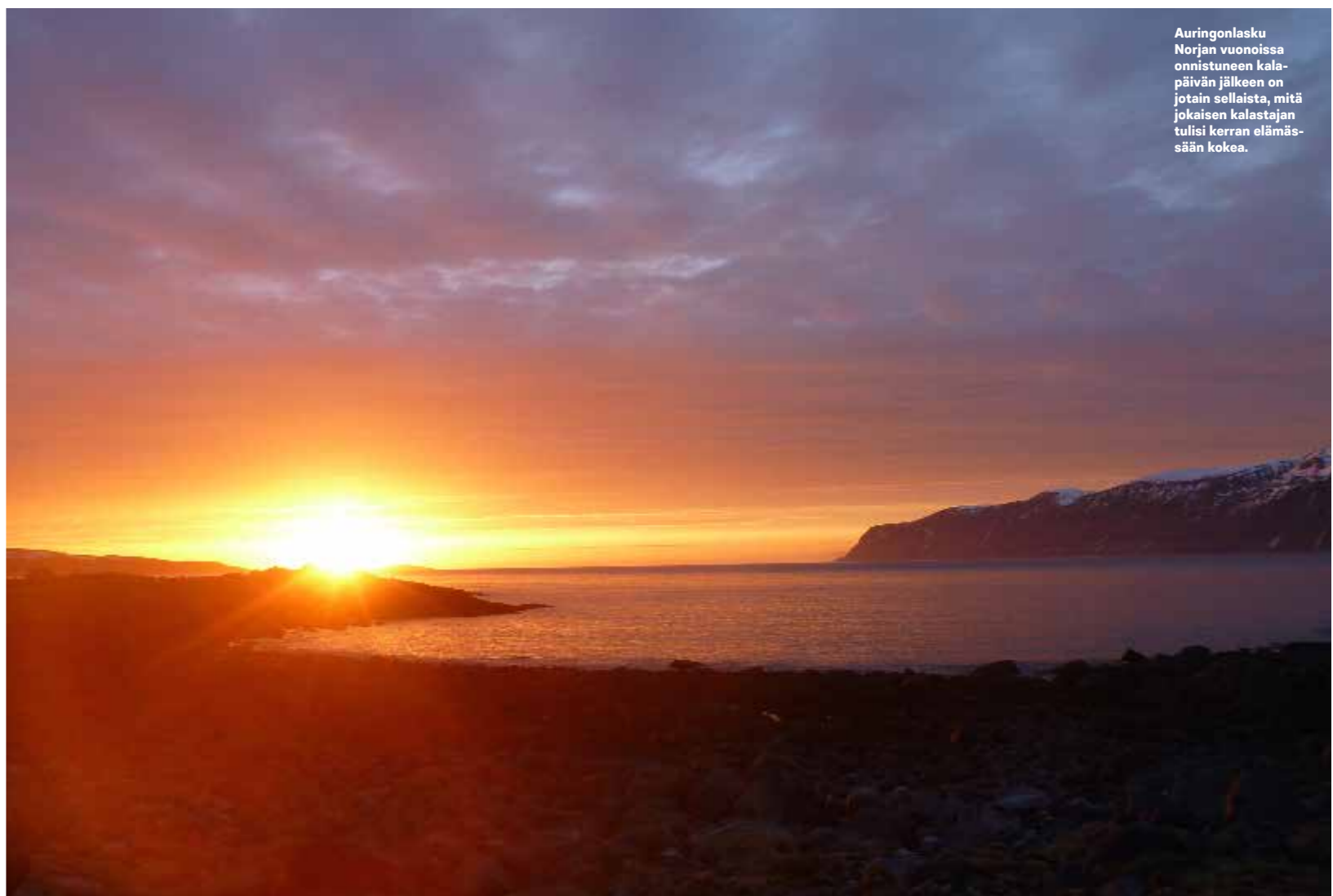
Auringonlasku Norjan vuonoissa onnistuneen kalapäivän jälkeen on jotain sellaista, mitä jokaisen kalastajan tulisi kerran elämässään kokea.

"Kannattaa paneutua kalastuskeskuksen nettisivuihin ja päivityksiin. Myös merikort-