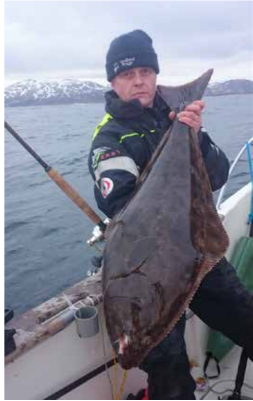
Ruijanpallas on Rainen suosikkikalat Norjassa. Uhanalaisen kalan pyynti pitää tehdä harkiten.

”Esimerkiksi potkurin kunto kannattaa kuvata ennen vesille lähtöä, ettei joudu maksamaan muiden aiheuttamia vaurioita.”