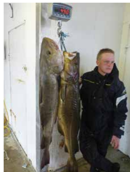
Lähes 50 kiloa turskaa ja vain kaksi kalaa. Norjan kalat ovat todella massiivisia.

"Pääasiassa kalastan Shimanon vipujarrullisilla keloilla, jotka ovat kiinni 30-50 lb -vavoissa. Vapojeni pituudet ovat 7-8 jalkaa, ja ne ovat kevyitä ja riittävän voimakkaita toiminnaltaan. Siimana käytän pääasiassa laadukasta 0,25-0,40 mm kuitusiimaa, ja tapaina 1-1,2 mm:n monofilaa. Siimojen liitoksissa käytän vain laadukkaita ja kestäviä leikareita ja jiggin kiepautan kiinni kestäväan